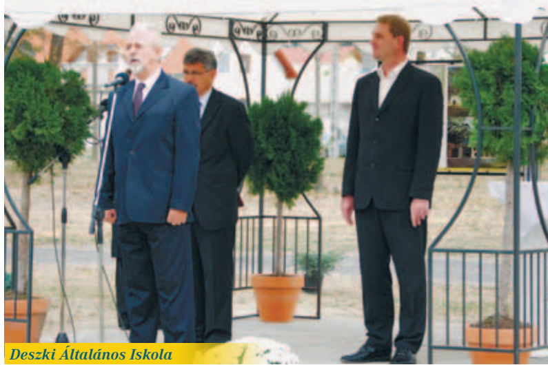
Deszki Általános Iskola

Több mint 1 milliárd forintért épül fel Algyő vadonatúj iskolája, amelyben 16 tanterem, speciális szaktantermek, többfunkciós tornacsarnok, multifunkcionális terek és étterem kap majd helyet. Az új épület alapkövét október 2-án, a Falunap keretében rakták le. Az eseményen jelen volt Varga Zoltán önkormányzati miniszter, Botka László, Szeged polgármestere, a Szegedi Kistérség elnöke, a térség országgyűlési képviselője, valamint a környékbeli települések polgármesterei