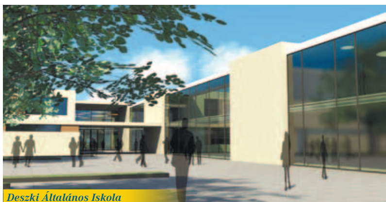
Deszki Általános Iskola