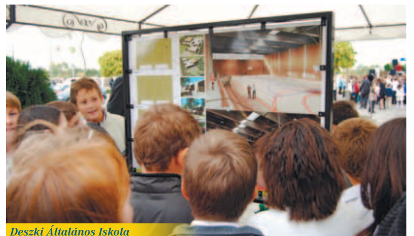
Deszki Általános Iskola

Az új iskolát energetikai szempontból felettebb gazdaságossá teszi, hogy termálhővel lesz ellátva, ami a fenntartási és üzemeltetési költségeket jelentősen fogja csökkenteni, ez a költségmegtakarítás mellett környezetvédelmi szempontból is előrelépés. Az olcsóbb fenntarthatóság mellett a beruházás célja a magasabb komfortfokozat elérése által lehetővé váló hatékonyabb munkavégzés és tanulás. A projekt célja egy modern és racionálisan kialakított tanulási környezet megteremtése. Ennek részeként az új épületbe a régi, elavult tantermi bútorok helyett az új iskolai berendezés kerül, továbbá a tornatermi eszközök és irodák bútorzata is megújul. Az épület teljes egészében akadálymentes lesz.