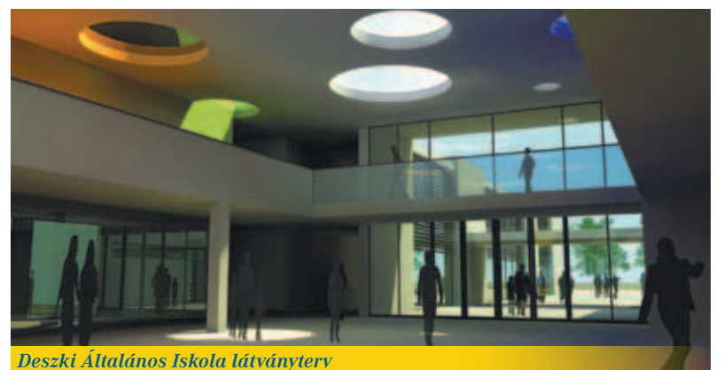
Deszki Általános Iskola látványterv