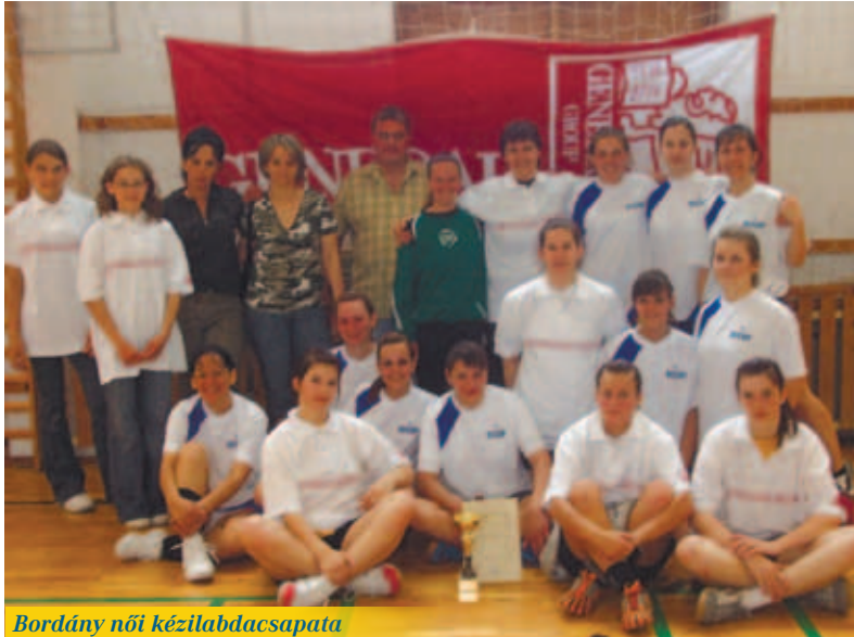
Bordányi női kézilabdacsapata