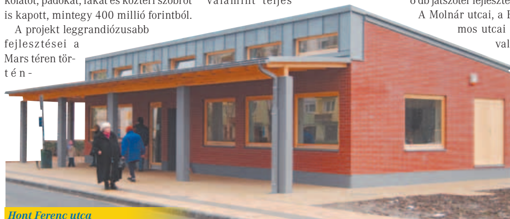
Hont Ferenc utca

ki, illetve tereprendezést végeztek. A beruházás 48 millió forintba került.