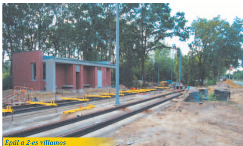
Épül a 2-es villamos

Csak néhány beruházást említenék: kezdődik a 4-es villamos építése, jövő tavaszra befejeződik a 2-es villamos építése, a belvárosi szakaszon folytatódik az 1-es vonal felújítása az Anna-kút és a Hősök kapuja között. Reményeink szerint elkezdődhet a városrehabilitáció második üteme, amelynek keretében újjá varázsoljuk a Dugonics és az Árpád teret. Emellett elkezdődik az Agora építése a Kálvária sugárút elején, amely egy új kulturális központja lesz Szegednek. Négyszázósítjuk a Vásárhelyi Pál utcát,