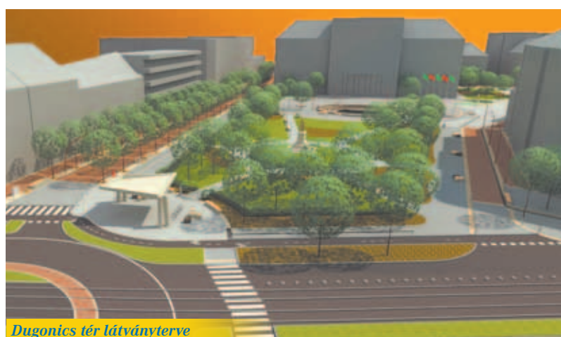
Dugonics tér látványterve

dologban. Abban biztos vagyok, hogy már most vannak ötleteik az ajándékokra. Egyébként a karácsonyt a családi hagyományoknak megfelelően a nagyszülőkkel, a testvéremmel és az ő családjával közösen töltjük. Ilyenkor nagy karácsonyi ünnep van a család mátrai nyaralójában. A menü is hagyományos, elmaradhatatlan a hal és a disznótoros. A halat az én szüleim, a disznótorost pedig feleségem szülei készítik. Természetesen nekem is van feladatom, én őzpörköltet készítek. Minden évben nagyon jó hangulatban, családiasan telnek az ünnepek.