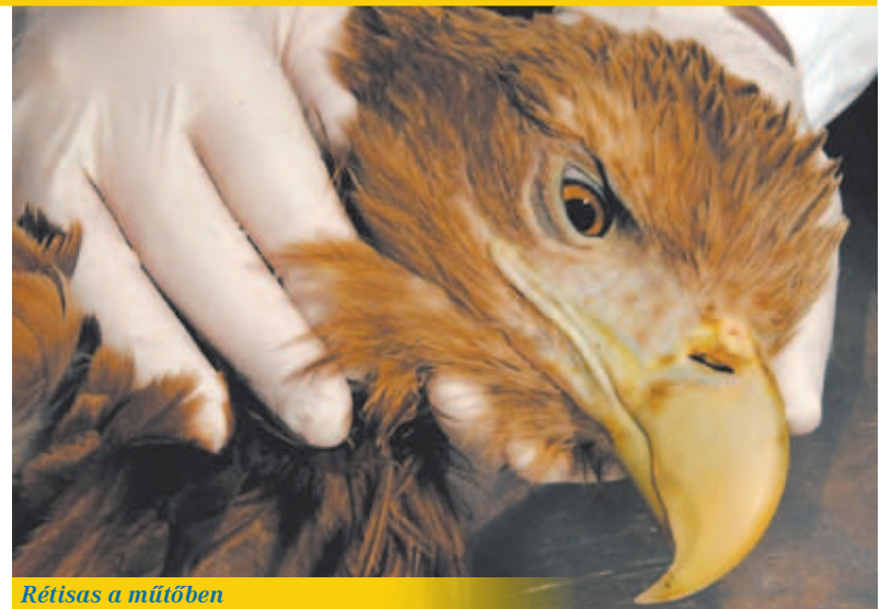
Rétisas a műtőben

A sérült madár nem tévesztendő össze a bizalmas, nyugodt madárral. Vergődik, menekülni próbál, esetenül verdes a szárnyaival, nem tud csak kisebb távolságokat repülni, siklani és hamar visszaesik a földre. Rosszabb esetben mozdulatlanul gubbaszt, felborzolja a tollait, nehezen lélegzik. Legelőször fontos megállapítanunk azt, hogy milyen fajról van szó, de ha ehhez nincs tapasztalatunk és megfelelő ismeretünk, akkor ez terepen nehezen működik. Kevesen tartanak maguknál állathatározót, de talán annyi ismerettel rendelkeznek, hogy megállapítsák ragadozó madár, esetleg gémféle, vagy énekesmadár került az útkjába. Ebben az esetben fogjuk be az állatot a legkíméletesebb módon úgy, hogy a magunk épségére is figyeljünk. Jót tesz, ha az állatot letakarjuk egy pokróccal, jobb híján pulóverünkkel, kabátunkkal. Ez megnyugtatja a sérült