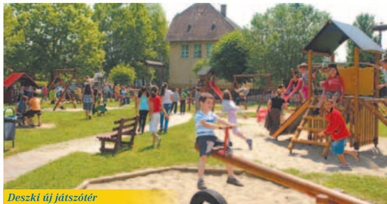
Deszki új játszótér

Sétányt építettek az új kalandpark, a foci pályával és persze a nagy települési rendezvényeink helyszínéhez, amelyek megközelítése így sokkal biztonságosan és kulturáltabb lett.