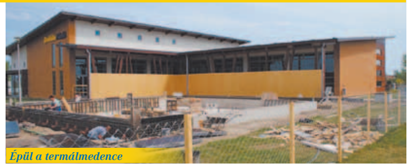
Épül a termálmedence

A víz hőfokából, valamint jellegéből eredően a 14 évnél idősebbek látogathatják majd ezt a medencét. Mivel cél