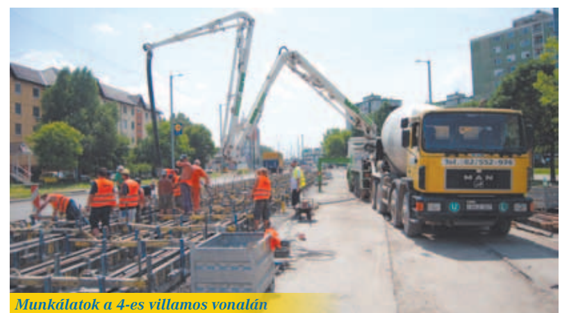
Munkálatok a 4-es villamos vonalán