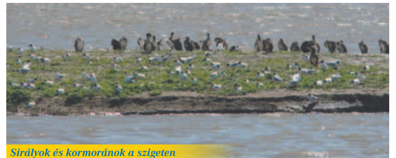
Sirályok és kormoránok a szigeten