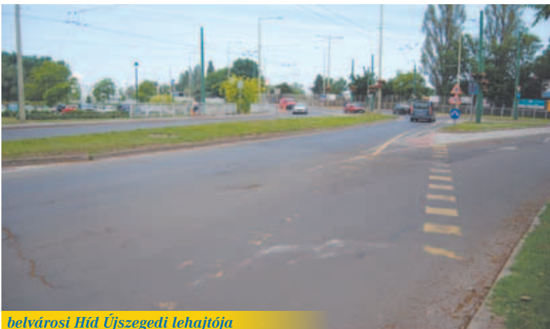
belvárosi Híd Újszegedi lehajtója