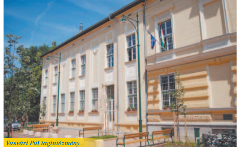
Vasvári Pál tagintézmény

Szeged Megyei Jogú Város Önkormányzata a szakképzési rendszer korszerűsítése, fejlesztése érdekében 2009. július 1-jei hatállyal alapította meg a Szegedi Kereskedelmi, Közgazdasági és Vendéglátóipari Szakképző Iskolát. Az intézmény holland modell szerint működik,