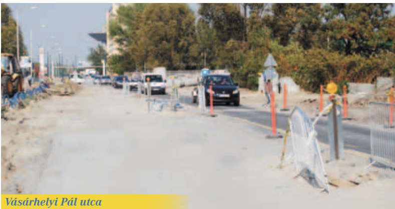
Vásárhelyi Pál utca

Folytatás az 1. oldalról László. A jelenleg is zajló munkálatok során az utcában új járdaburkolatot építünk, megújul a közvilágítás, utcabútorokat helyezünk ki és kertészeti munkákat fogunk elvégezni. A beruházás összköltsége 324 millió forint.