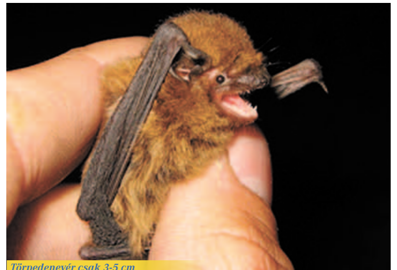
Törpedenevér csak 3-5 cm

sötétben leggyakrabban a búvóhelyük közelében. Miután éjszaka aktív állatokról van szó, ezért búvóhelyük nappal nyújt számukra védelmet. Faodvakban, padlásokon, barlangokban húzódnak meg, de a kihelyezett mesterséges denevérodúban is megtelepsznek. Városi lakótelepeken a panelépületek hézagait is előszeretettel választják otthonul. Előfordult már többször, amint nyári meleg éjszakák nyitott ablakain berepült a denevér a szobába, és kitaró köröket írt le a lakásban. Amikor ezt a lakó észrevette, ijedtében a takarót a fejére húzva várta meg a reggelt, mert nem mert előbújni, félve a repülő „fenevadtól”.