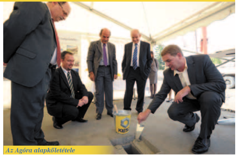
Az Agóra alapkőletétele

A Vásárhelyi Pál utca négy-sávósítása mintegy 300 millió forintból valósul meg. A pályázati kiírás szerint az út alatt elhelyezkedő közművek átépítésére támogatást nem lehetett igényelni, így azokat a város önerőből finanszírozza. Épül egy új főgyűjtő csatorna is, amely a szomszédos telephelyek és a csatlakozó utcák csapadékvíz elvezetését oldja meg. Az építkezés tehát több lesz, mint egy