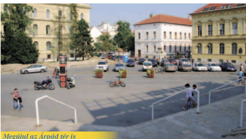
Megújul az Árpád tér is