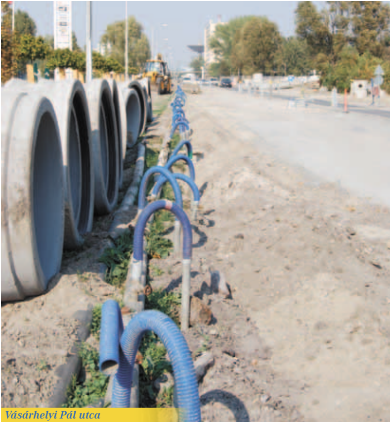
Vásárhelyi Pál utca