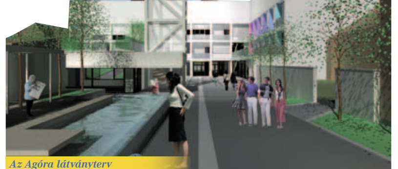
Az Agóra látványterv

A munkálatok várhatóan idén november végén fejeződnek be. Ezt követően várhatóan