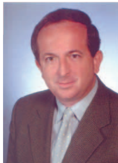
BODÓ IMRE, TISZASZEGED POLGÁRMESTERE