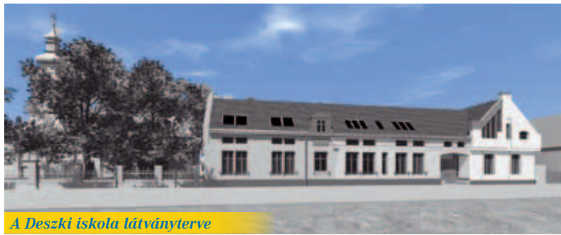
A Deszki iskola látványterve