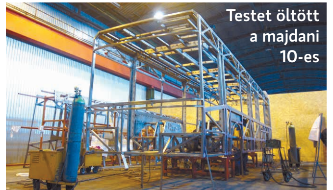
Testet öltött a majdani 10-es

Fölismerhető formát öltött Szeged új trolibuszainak egyike Székesfehérváron. A város számára gyártott új járművek prototípusa várhatóan augusztusban érkezik Szegedre, a többi 12 pedig egy éven belül követi. A járművekre már kész felsővezeték vár a majdani 10-es vonalon.