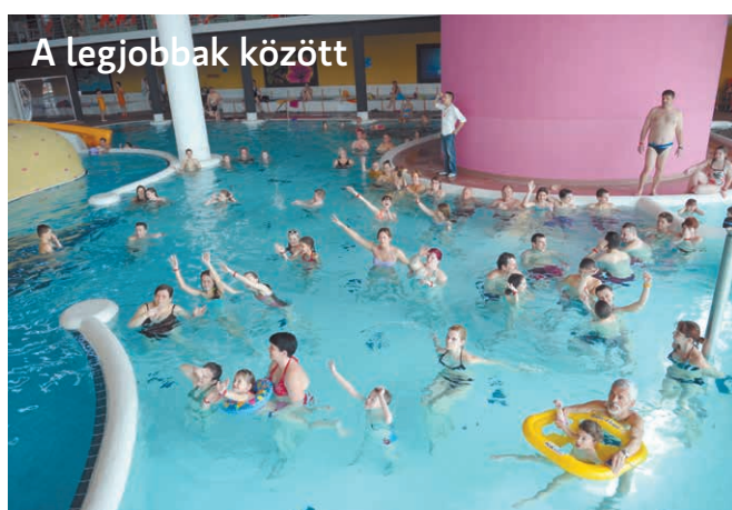
A legjobbak között

Az 5 csillagos minősítés odaítélését egy szegedi konferencián jelentette be a közelmúltban Vancsura Miklós, a Magyar Fürdőszövetség ügyvezető elnöke. A szakember elmondta, hogy a szervezet minősítő bizottsága több mint száz szempontot figyelembe véve dönt a csillagok odaítéléséről. Ilyen szempont például a parkolási lehetőség, a személyzet teljesítménye és