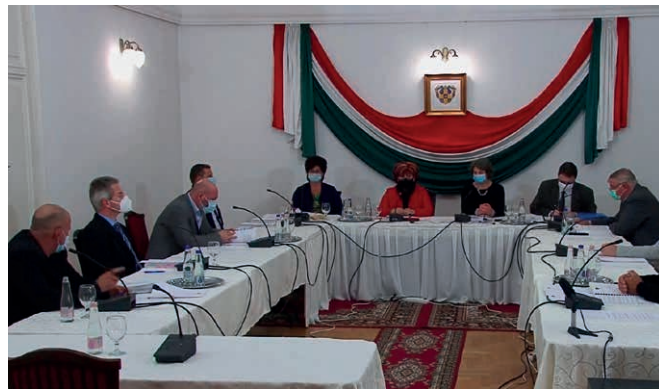
A járványhelyzet miatt októberben tudták megtartani hagyományos módon az utolsó képviselő-testületi ülést

Saját beruházásokat, fejlesztéseket 45 millió forint értékben terveztek az idén. Ebből alakítják ki az általános iskola előtti buszvárót, az EESZI idősok nappali ellátását biztosító telephelyén egy tárolót, valamint pályázattal nem fedezett beruházásként a városi térfigyelő kamerarendszer felújítása és bővítése, illetve ingatlanok vásárlása is ebből az összegből történik.